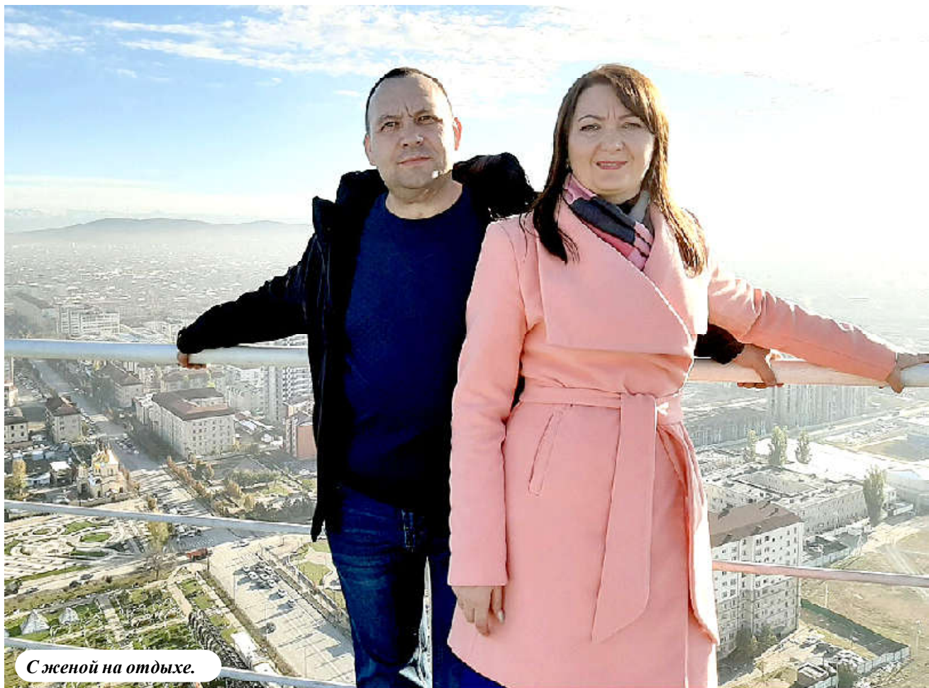
С женой на отдыхе.