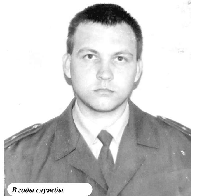
В годы службы.